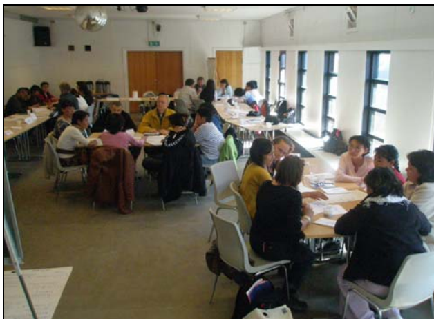
Tasiilaq sommer 2007

Alle steder starter vi med en præsentationsrunde – startende med psykologen . I enkelte tilfælde har det været fristende at undlade denne runde, nemlig ved de store kurser, men tiden er godt givet ud: at hver især allerede fra starten har sagt noget i rummet betyder, at alle allerede første dag har bidraget til det fælles "rum" og det lønner sig på mange måder.