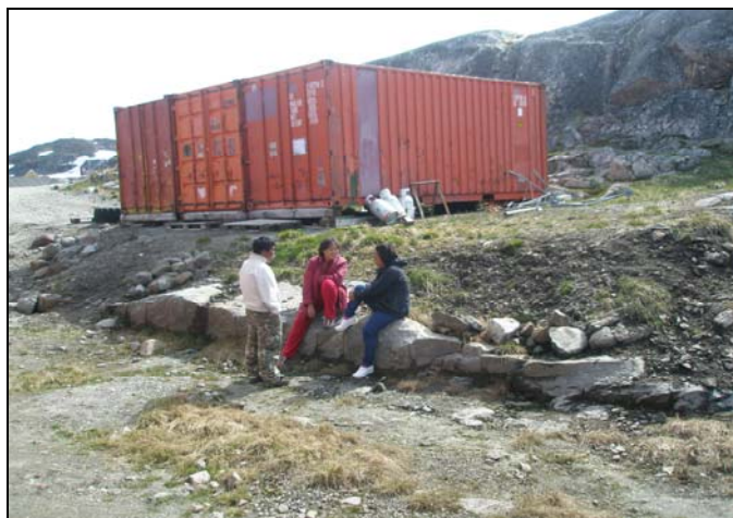
Gruppearbejde i Kulusuk