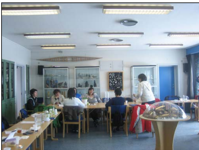
Gruppearbejde i Sisimiut

Deltagerne har været velforberedte, engagerede, interesserede og punktligt med tingene omkring kurserne. De fleste er ikke uddannet til det job, de varetager, så vi kan kun nære dyb respekt for det arbejde, de udfører – selv om det naturligvis kan udvikles og forbedres. De lokale medarbejdere slider hårdt i det og må ofte "fægte sig frem", fordi de ikke har viden om det, de har med at gøre.