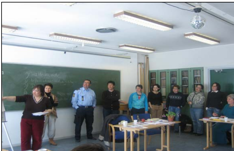
Fremlæggelse i Sisimiut

Alle grupper har haft noget at præsentere i denne slutrunde – alle har fået noget med hjem.