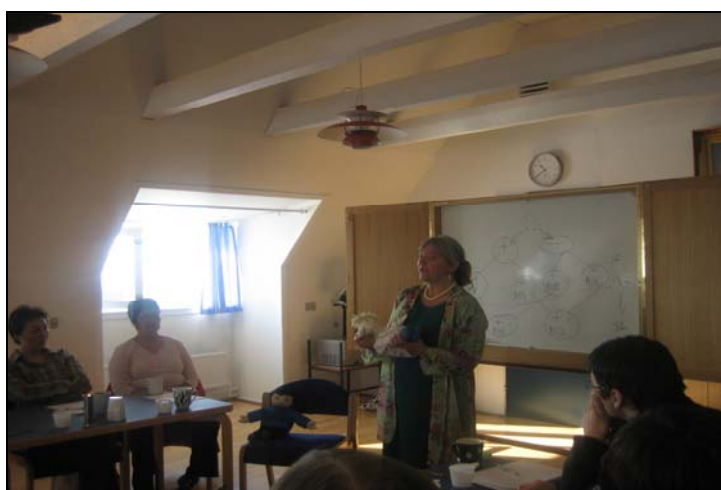
Tværfaglig kursus i Qeqertarsuaq

Men i betragtning af rejsernes omfang føler vi os trods alt heldige. Vi er blevet godt modtaget og indlogeret overalt, og det har en stor betydning, når man er af sted i så lange perioder, som vi af og til har været. Det sted, man skal "bo" og hente kræfter til næste dags arbejde er utrolig vigtigt. Det behøver ikke vær stort og prangende, det kan sagtens være småt og beskedent, men det skal have en varm og venlig atmosfære – og det har alle vore logier haft.