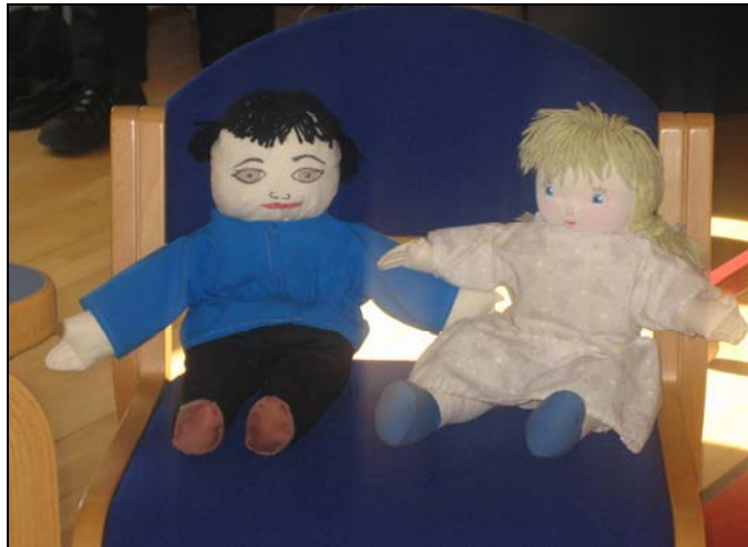
Ujarak og Elisabeth i Qeqertarsuaq

Vi har brugt de to kludedukker Elisabeth og Ujarak til at illustrere de to grundlæggende forskellige måder, børn kan reagere på, når de tilpasser sig overgreb – internaliserer overgreb som del af deres liv. Elisabeth og Ujarak er syet til at fortælle om omsorgssvigt: begge har en del af sig selv indkapslet i hjertet, fortrængt eller spaltet fra som noget, der ikke er "mig", og den konkrete form, som teorierne får ved hjælp af Elisabeth og Ujarak har alle steder bygget bro mellem teorierne og de reelle børn i kursisternes forståelse af de skader, omsorgssvigt kan afstedkomme for børnene. På en helt særlig måde har Elisabeth og Ujarak fået deres eget liv, nyt hver gang, men meget "nærværende" i rummet.